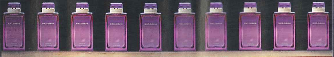
Eau de parfum Intense, Dolce&Gabbana