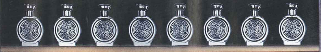
Eau de parfum Imperial, Boadicea The Victorious