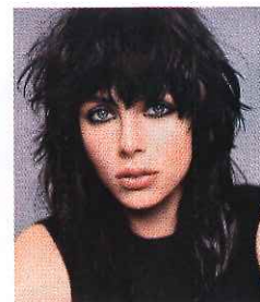
Edie Campbell, un volto da rockstar per il nuovo Black Opium di Yves Saint Laurent (da 30 ml, € 63).

N on rinnega le proprie origini Black Opium, nuova versione dell'iconico profumo firmato Yves Saint Laurent . Al contrario: del jus capostipite eredita lo spirito ribelle e lo fa proprio, atualizzandolo. A partire dal flacone: scintillante, dell'originale mantiene solo l'oblò centrale (qui tinto di rosa). Quindi la composizione: nota centrale è l'essenza di chicchi di caffè, per la prima volta impiegata in una fragranza femminile. A corollario: fiori bianchi, accenti gourmand e note boisé. Un sillage conturbante quanto il video che ne accompagna l'uscita: ambientato in una Shanghai notturna e psichedelica, ha come protagonista Edie Campbell, modella con il piglio da rockstar.