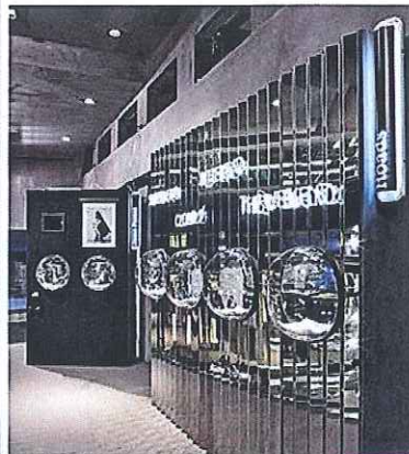
A sinistra, l'olfattorio creato per la presentazione delle sue fragranze To be honest , Desired e In Pursuit of Magic . Sotto, il soundtrack di Lezioni di piano .