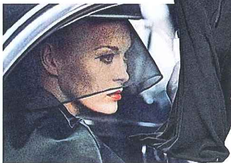
Foto: illustrazione di Peter Lipmann; Mike Figgis di Greg Purcell; Mannequin di Larry