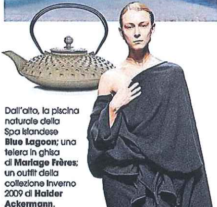
Dall'alto, la piscina naturale della Spa Islandese Blue Lagoon ; una teiera in ghisa di Marlage Frères ; un outfit della collezione Inverno 2009 di Haider Ackermann .