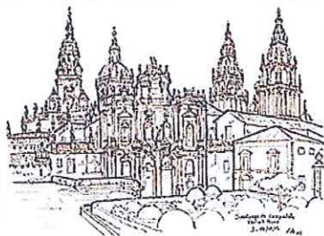
Sopra, un'immagine del santuario di Santiago de Compostela ; a destra, Faye Dunaway in Mannequin - Frammenti di una donna (1970), di Jerry Schatzberg, regista e fotografo.