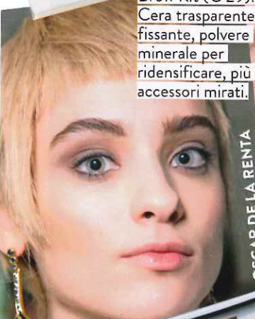
OSCAR DE LA RENTA

Nell'Ecrin Sourcils di Guerlain, tre polveri colorate dall'azione riempitiva, una più chiara per illuminare l'arcata sopraccigliare, più l'applicatore (€ 41,70).