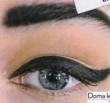
JEAN PAUL GAULTIER

Doma le sopracciglia ribelli con una cera pigmentata ricca di vitamina E: Eyebrow Design Set di Pupa (€ 16, in tre nuances).