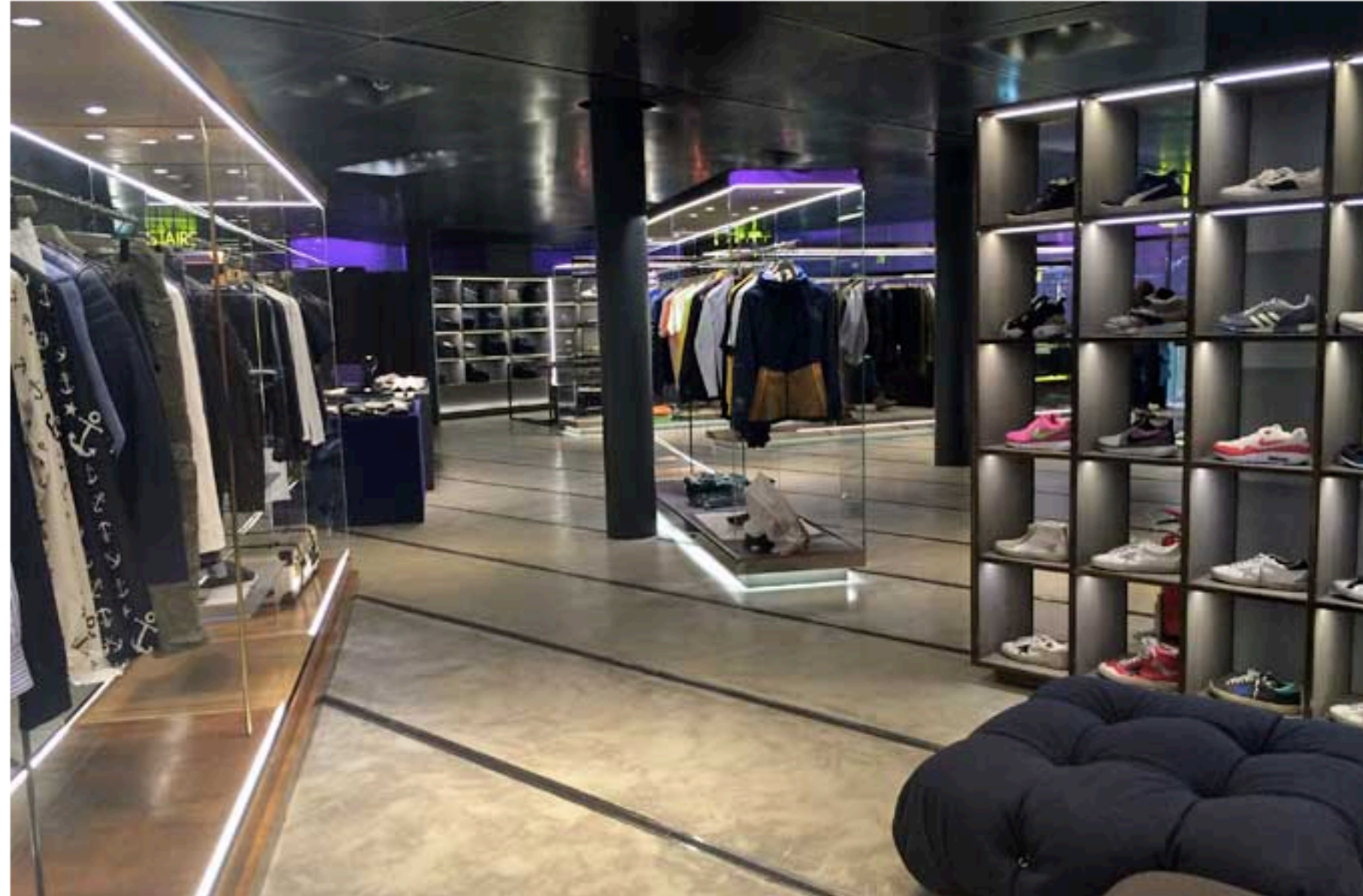
Il reparto icon temporary di Excelsior

Salendo, si passa ai quattro piani dedicati alla moda: c'è la sezione icon temporary (la mia preferita, dedicata allo sportswear di Converse, Nike, Adidas, su tutti) e c'è il mondo Antonia, declinato tra uomo, donna e accessori. Uno spazio dove sognare tra calzature Jimmy Choo e Christian Louboutin, abiti Chloé, accessori Manolo Blahnik e meravigliose borse di Givenchy.