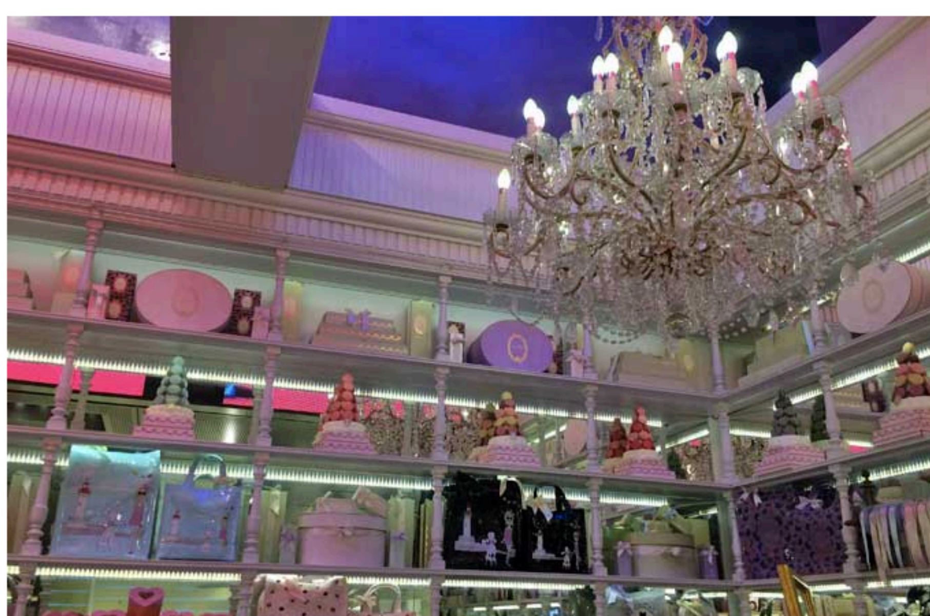
Il corner Ladurée

Come dicevo, si tratta del format di lusso del Coin. Dietro i prodotti che si trovano in vendita da Excelsior c'è sicuramente una buona dose di marketing, ma anche tanta passione e ricerca. Per chi si lamenta dei prezzi eccessivi bisogna di andare, appunto, al Coin. Altrimenti, è bellissimo anche soltanto entrare, rifarsi gli occhi, e uscire con all'attivo un balsamo per capelli, un macaron e poco altro come faccio io (questa era una bugia, ci esco molto spesso anche con la spesa per la sera!).