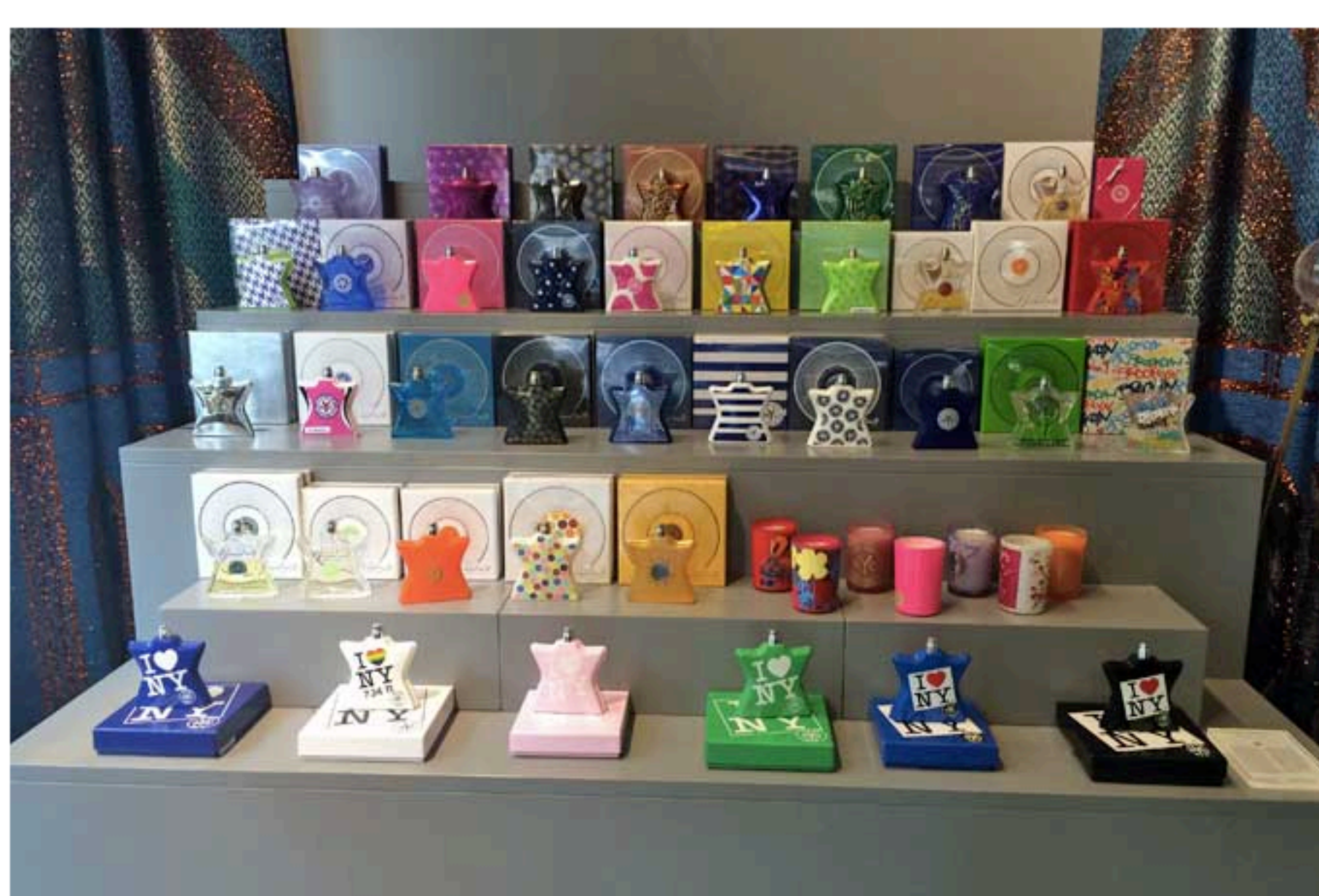
I profumi Bond n° 9

Di Excelsior mi piace il fatto che tutto sia in perfetto ordine: mi rilassa entrare e trovare tutto sistemato a dovere, senza quella ressa tipica dei negozi del pieno centro. Mi piace anche che si possa trovare di tutto, dal cibo ai vestiti passando per il beauty semplicemente salendo o scendendo una scala. E mi piace, soprattutto, la ricerca che si intravede dietro ogni singolo prodotto: se siete dei cool hunter o, semplicemente, vi piace stare al passo con le novità, questo è il luogo giusto per voi.