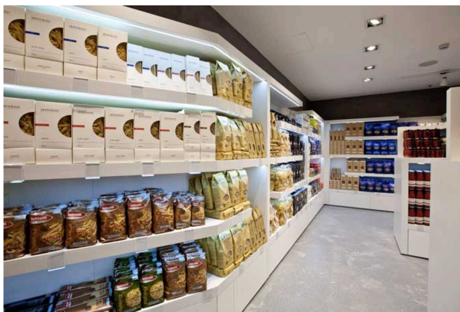
L'Eat's Store

I prezzi della frutta e della verdura sono più elevati rispetto alla norma, mentre per il pane, la carne e il pesce non trovo ci siano differenze importanti in confronto all'Esselunga di turno. Eppure c'è di tutto: frutti della passione, noci e frutta secca già preparata, una panetteria ben fornita, e poi i banchi dedicati ai sughi, alla pasta e ai dolci, come lo scaffale dedicato agli splendidi cioccolati di Guido Gobino.