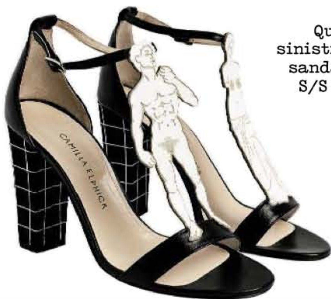
Qui a sinistra, sandali S/S 17.